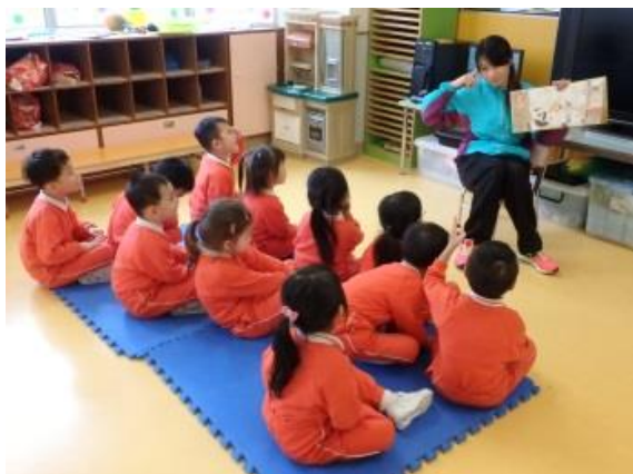
兔子生日呀，你估下發生咩事？