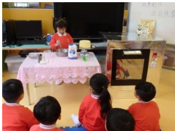
我扮演兔子，製作蛋糕準備生日會呀。