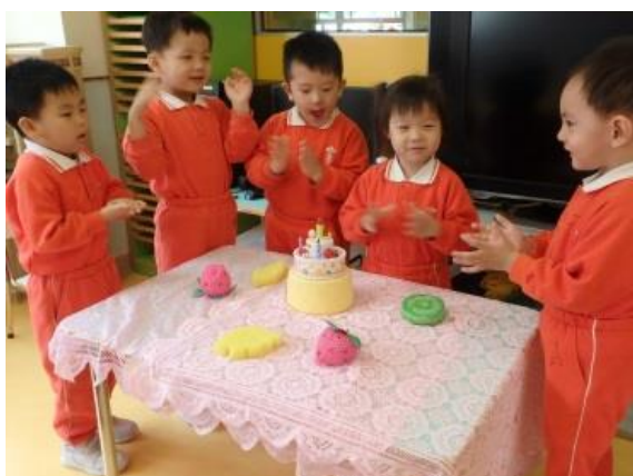
Happy birthday to you... 生日快樂呀!